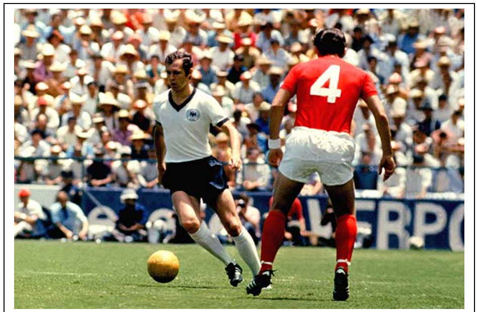
Beckembauer con el balón en un momento del apasionante Alemania F.-Inglaterra de cuartos de final de 1970.