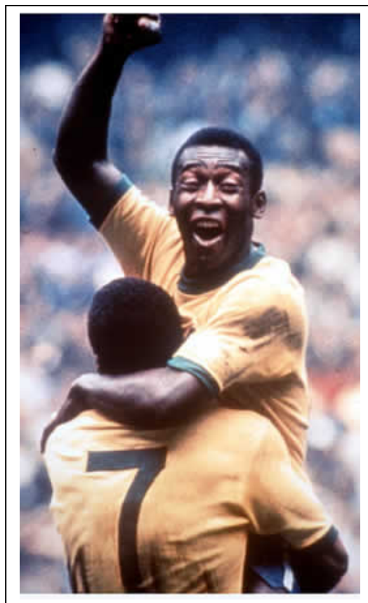
Brasil se abraza a Jairzinho tras marcar frente a Italia.