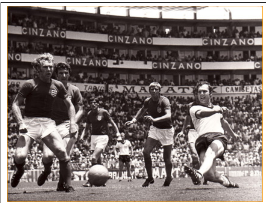
Beckembauer en otro instante del mismo partido, intentando tirar a puerta.