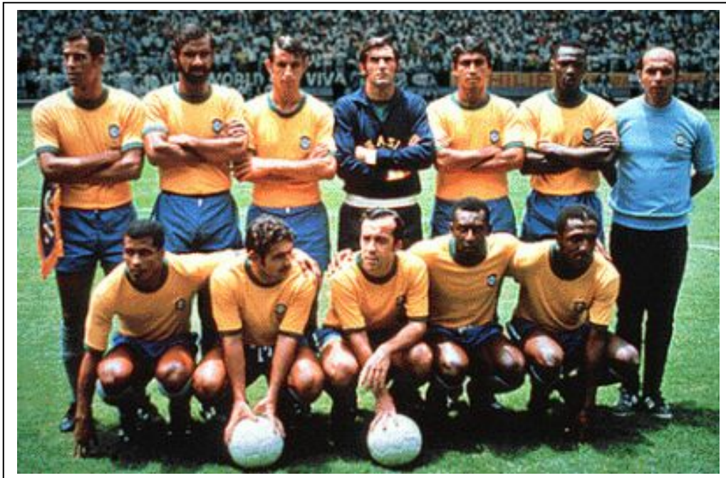
Este es el equipo brasileño de 1970. Su fútbol nunca fue igualado como conjunto. Solo la Argentina de 1986 le llegó a igualar en algunos momentos puntuales, pero en ese equipo había un jugador que destacaba sobre el resto: Maradona. En éste, Brasil era el Rey, pero Brasil era un conjunto compacto.