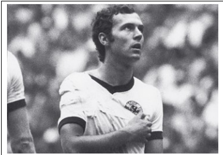
Esta imagen muestra la lesión de Beckembauer frente a Italia en semifinales. Jugó en torno a una hora con el brazo en cabestrillo.