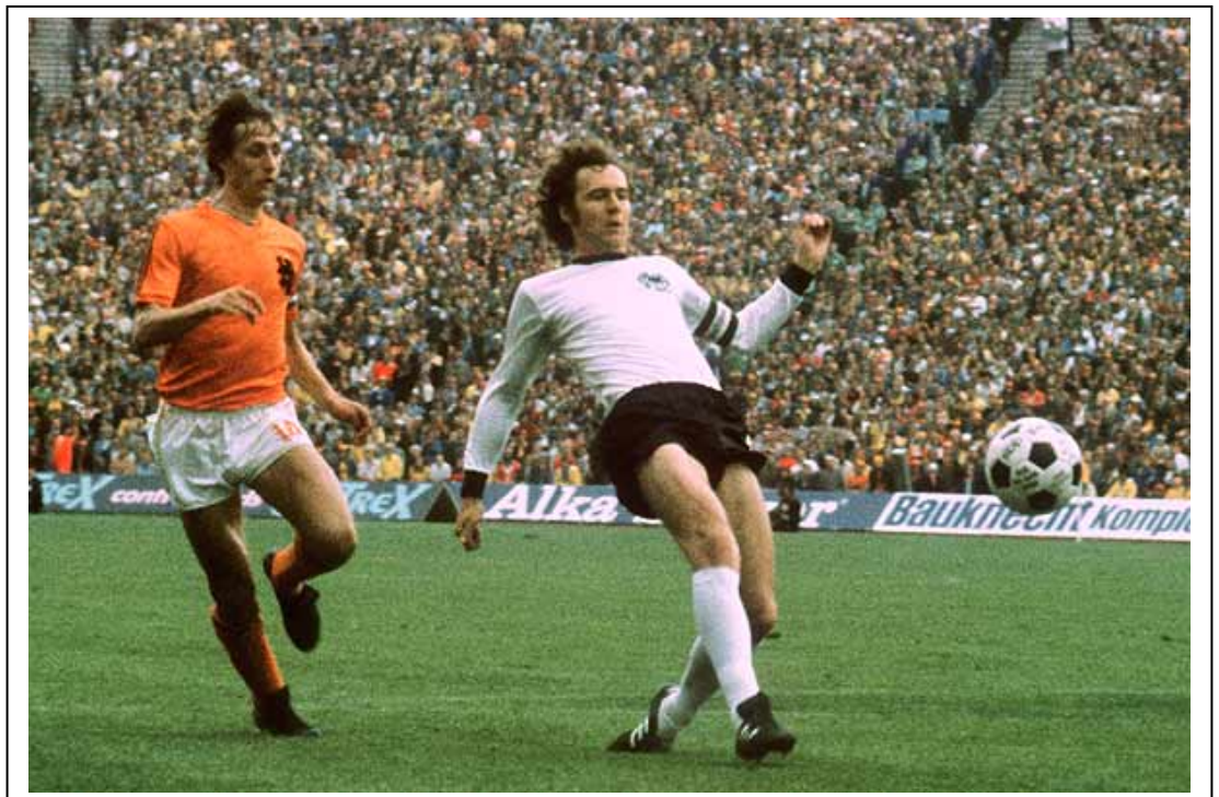
Los dos mejores jugadores del momento: Cruyff y Beckembauer. El segundo le ganó la partida al primero.