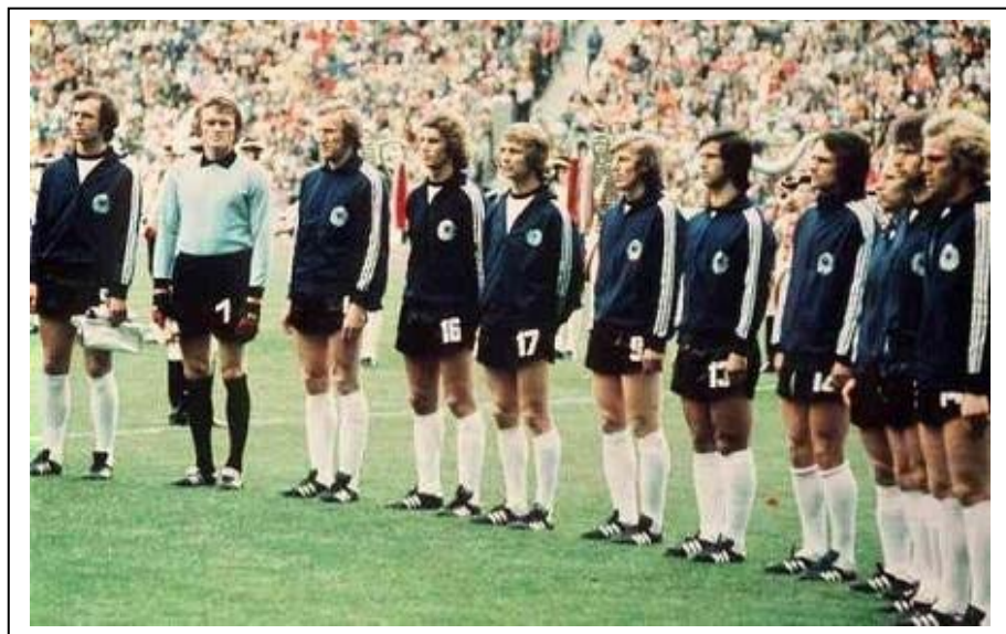
Selección alemana que disputó la final de Munich en 1974. Su fútbol sería más fácil de jugar que el de los holandeses, era por tanto, más popular. Y su triunfo en 1974 hizo que muchos equipos lo adoptaran.