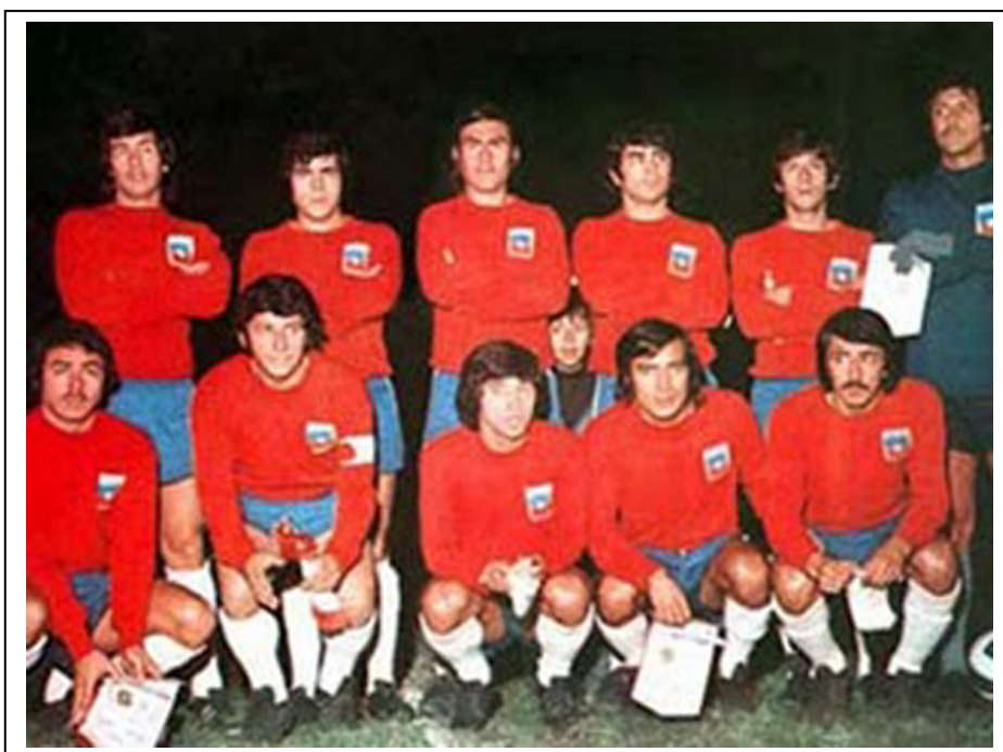
Selección chilena que jugaría el mundial de Alemania. Chile pasó porque la URSS se negó a jugar en Santiago la vuelta de la repesca, tras el triunfo del golpe militar de Pinochet a finales de 1973.