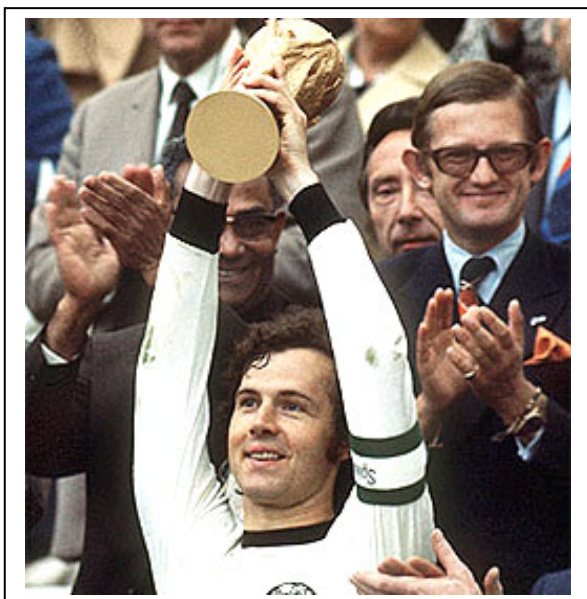
Beckembauer levantando el segundo título de Alemania Federal. Tras el conseguido en 1954, Alemania Federal, veinte años después, volvía a estar en lo más alto del fútbol mundial.