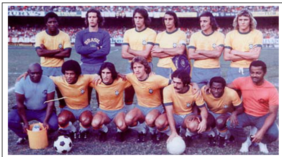
Formación brasileña antes de disputar el partido frente a Escocia en la primera ronda.