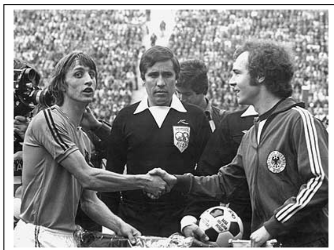
Cruyff y Beckembauer, capitanes, intercambiándose suertes y banderines.