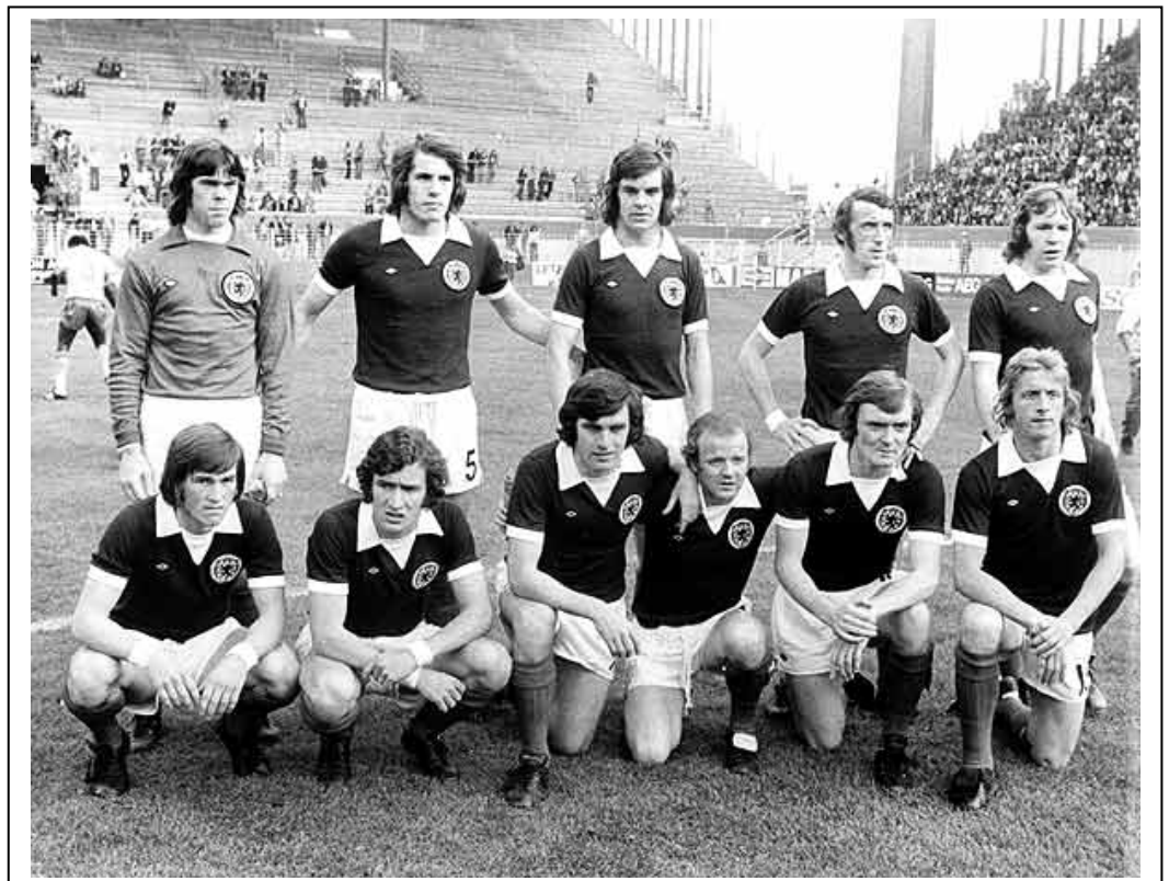
Ésta es la selección escocesa que tendría mejor suerte en 1978. En 1974, a punto estuvieron de eliminar en el grupo a Brasil.