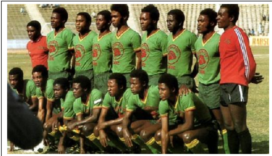
Ésta es la famosa selección de Zaire que jugó el mundial de 1974.