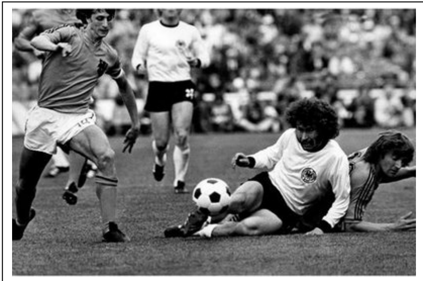
Un lance de la final en que Paul Breitner cae delante de Cruyff.