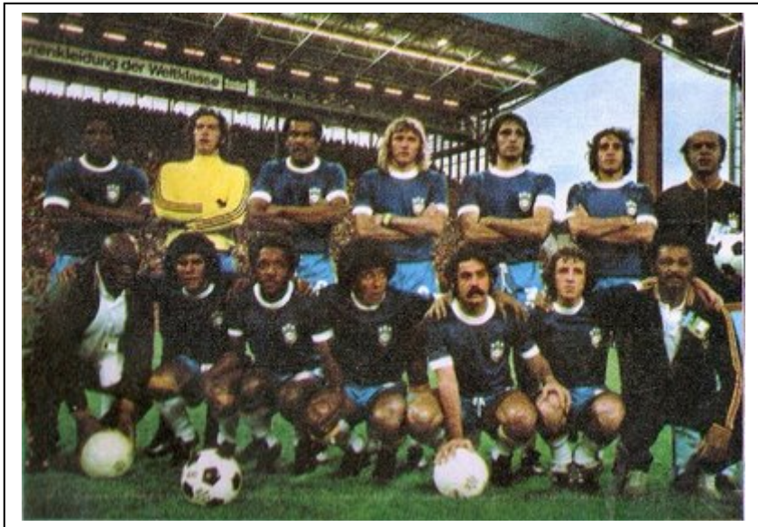
Selección brasileña antes de jugarse su pase a la final frente a Holanda. Sin embargo, Brasil estaba a años luz de su equipo de 1970.