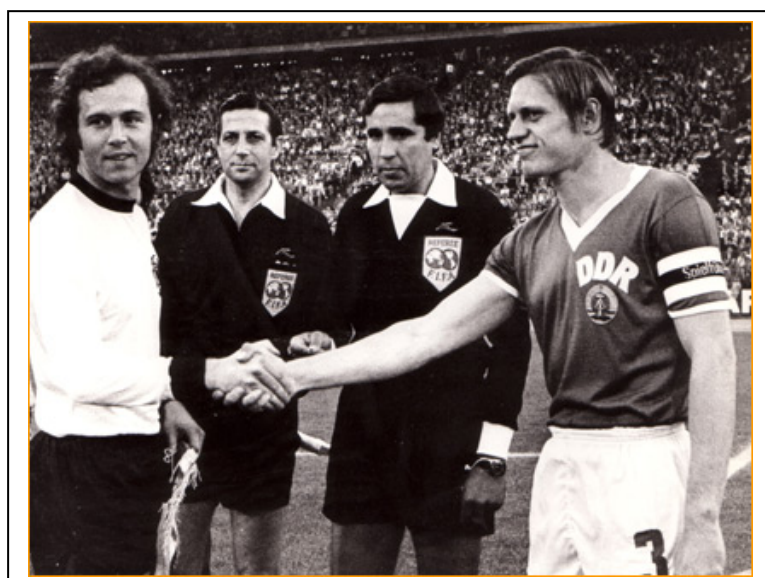
Imagen del intercambio de banderines del famoso Alemania Oriental-Alemania Occidental. Fue el auténtico partido de la Guerra Fría en los mundiales.