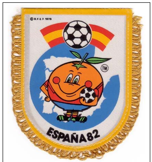
Banderín para auto alusivo al mundial de España y al adefesio de mascota.