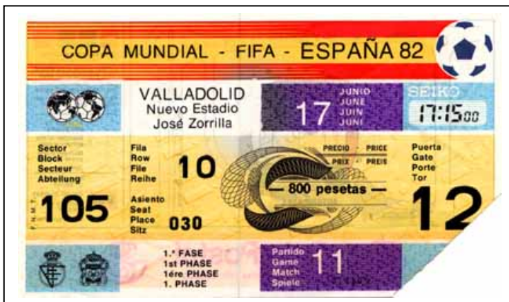
Entrada correspondiente al Francia-Kuwait de la primera fase.