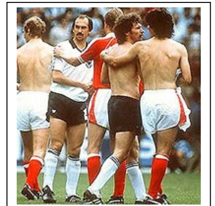
Alemania y Austria intercambian camisetas después de haber pactado el resultado de 1-0 favorable a los alemanes.