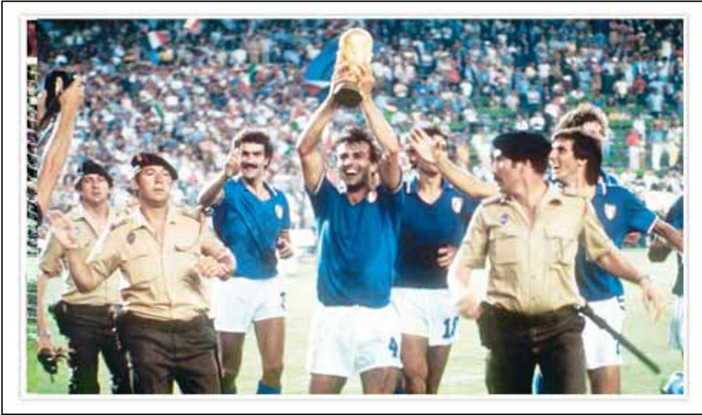
Los jugadores italianos levantan el trofeo en el césped del Bernabéu.