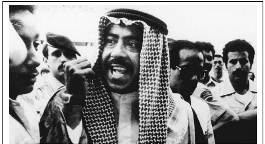
El príncipe Fahd de Kuwait consigue que el árbitro Stupar anule un gol a Francia frente a su equipo.