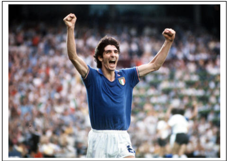
Paolo Rossi celebrando uno de los goles de la final frente a Alemania. Sería pichichi con 6 tantos.