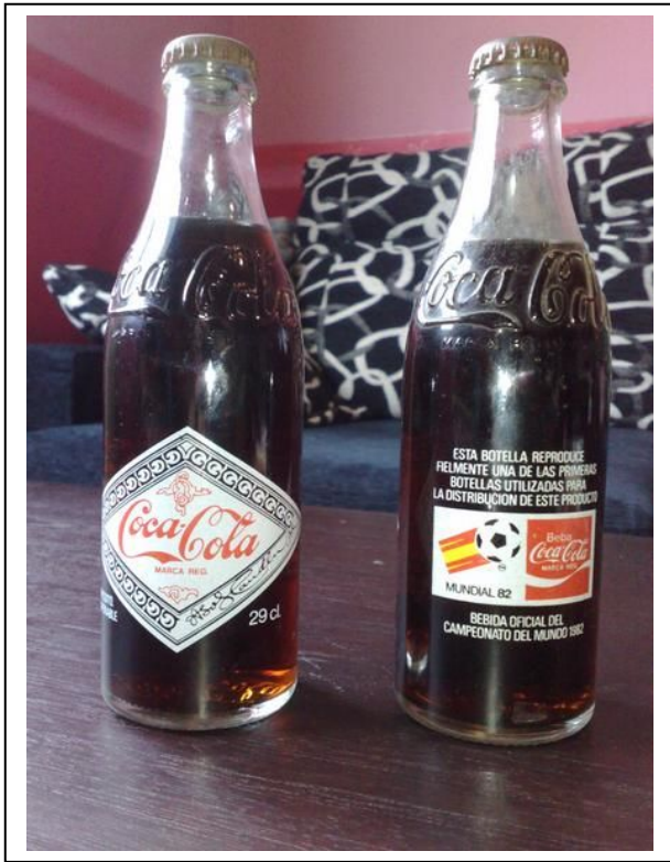
Dos botellas de Coca-Cola con los motivos del mundial de España 1982.