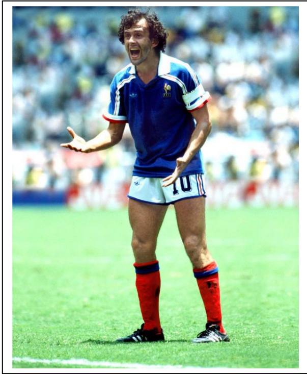
Michel Platini, una de las estrellas del mundial 1982.