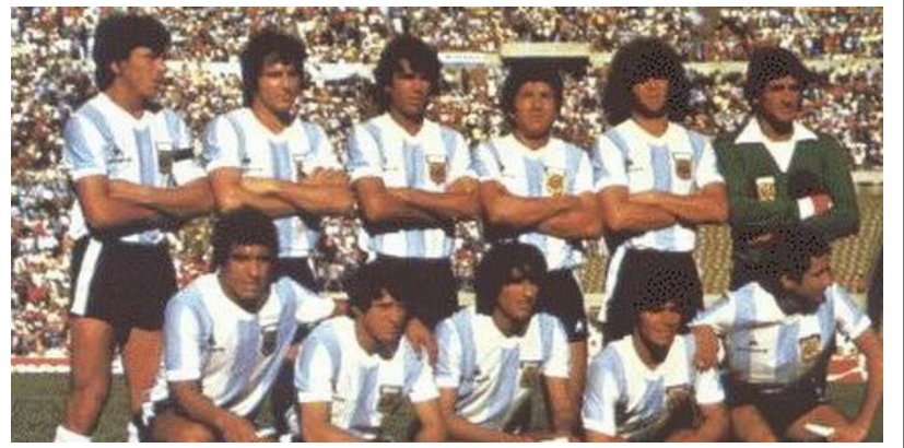
Equipo argentino que defendió título en España 1982.