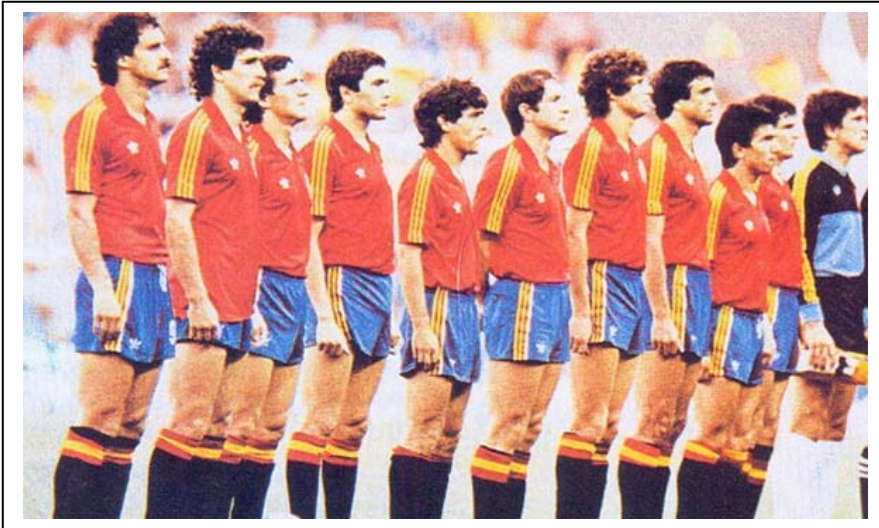
Selección española momentos antes de jugar frente a Alemania. Como podemos comprobar, el meta Arconada no llevaba las medias reglamentarias y optó por usar unas de color blanco, lo cual fue vinculado a una amenaza etarra.