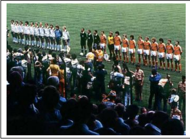
Alemania y Austria antes de empezar el partido cuyo resultado estaba pactado de antemano.