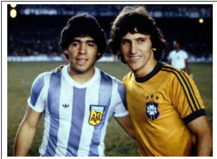
Maradona y Zico en el partido de segunda fase que ganó Brasil por 3-1 frente a Argentina.