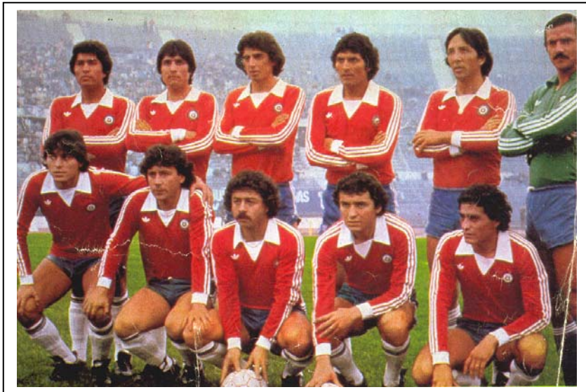
Selección chilena que disputó la fase final de España 1982.