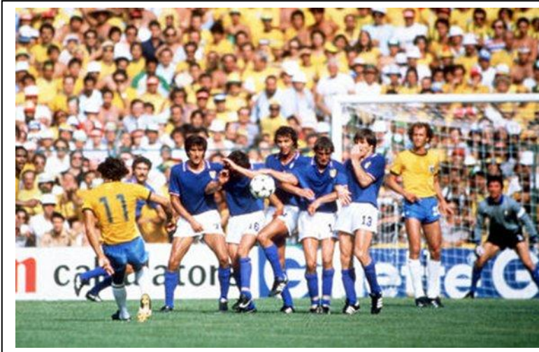
Momento en que Sócrates lanza una falta frente a Italia en Sarriá, en el partido de cuartos de final que ganó Italia.