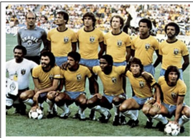
Selección brasileña que disputó el mundial de España 1982.