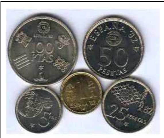
La numismática no iba a permanecer ajena al acontecimiento. Se grabaron varias monedas alusivas al mundial de 1982. Destaca, sobre todo, el escudo nacional, que ya está desprovisto del águila, aunque en la moneda de 1 peseta que se ve, aún permanece.