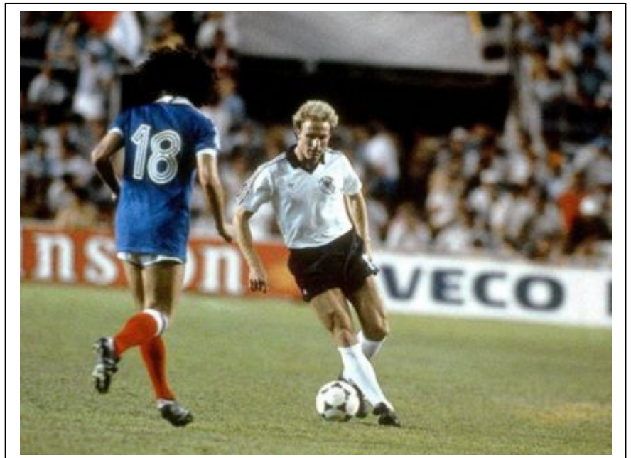
Momento del espectacular Francia-Alemania Federal de semifinales en el Pizjuán de Sevilla.