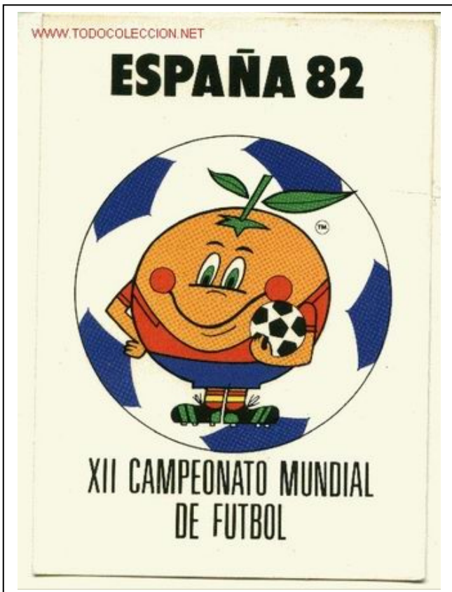
Cartel en el que aparece la mascota, Naranjito, muy criticado por todos, ya que era un auténtico adefesio y representaba a una naranja vestida con el traje de la selección española... el presagio no era muy bueno.