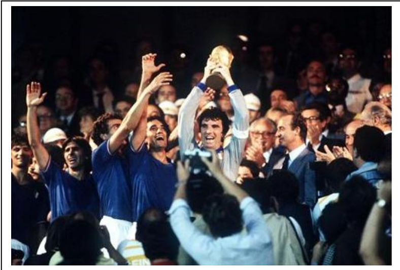
Momento en que el rey le entrega a Zoff, el capitán italiano, la copa del mundo de la FIFA.