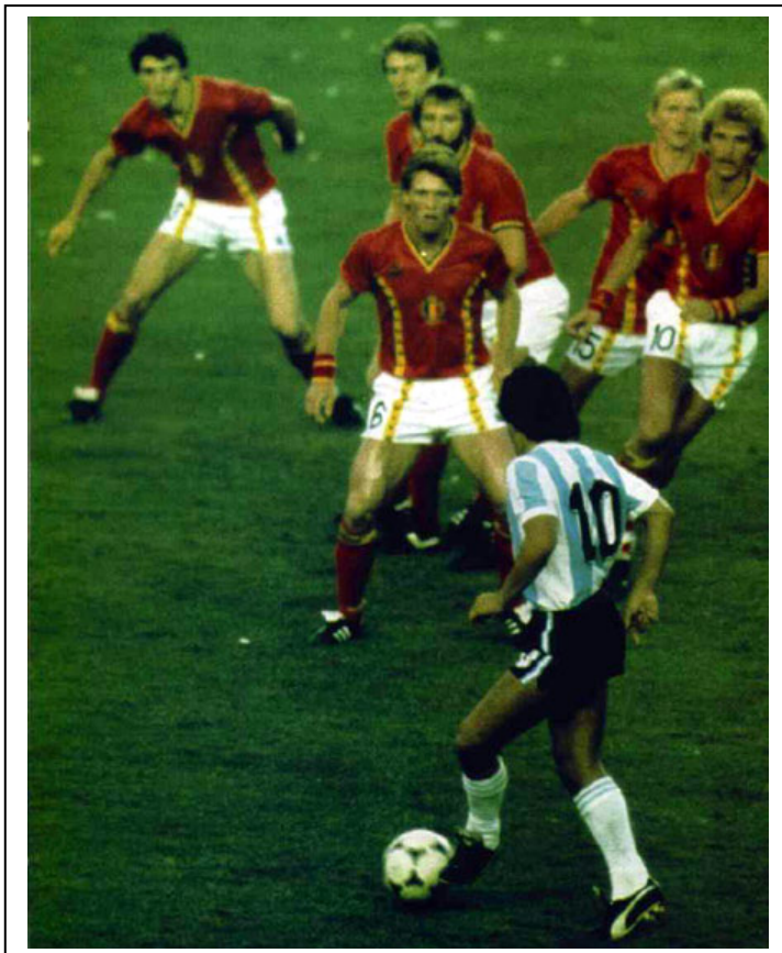
Imagen del partido inaugural del Camp Nou. Argentina perdió por 1-0 frente a Bélgica en la primera sorpresa del mundial.