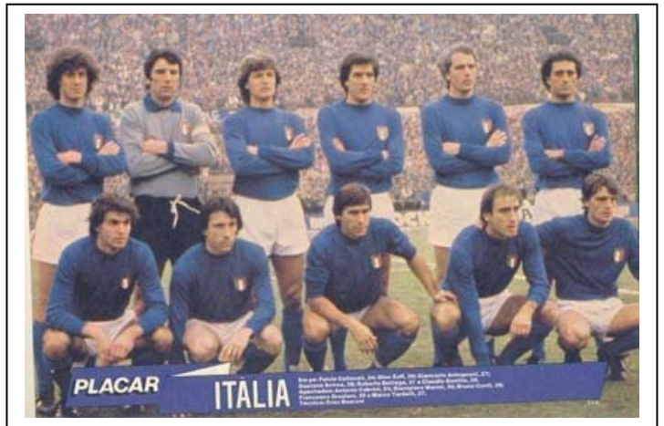
Equipo italiano que se proclamaría campeón del mundo después de 44 años.