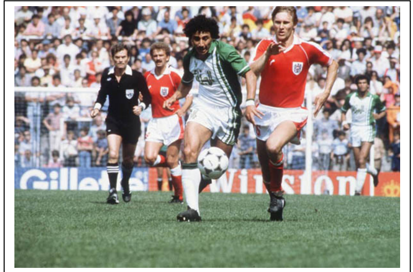
Partido entre Argelia y Austria de 1982. Argelia había ganado a Alemania y en la última jornada ganó a Chile. El resultado pactado de austriacos y alemanes les eliminó.