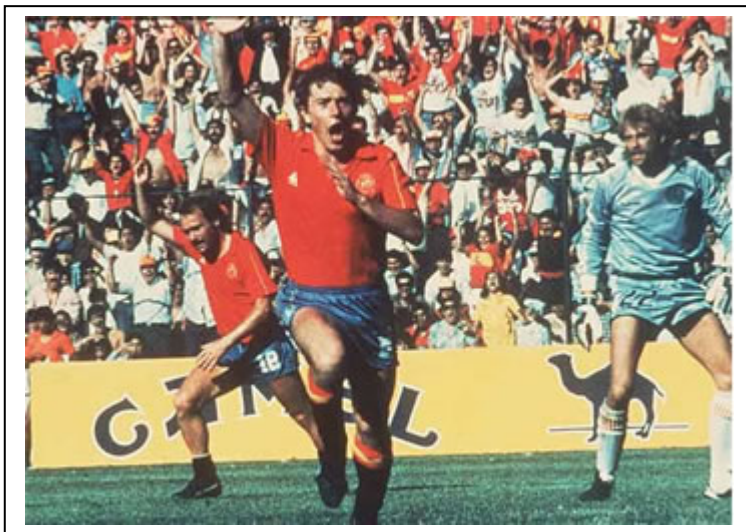
Famosísima foto de la furia española encarnada por Butragueño, que metió cuatro goles a Dinamarca.