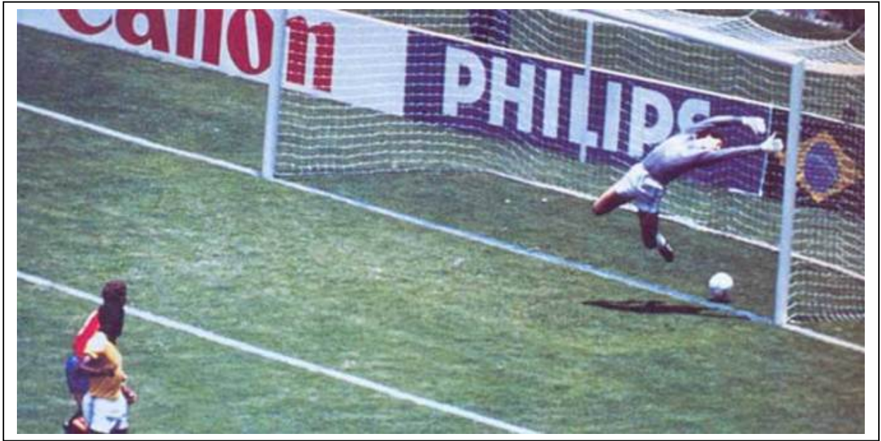
La imagen que dio la vuelta al mundo. Es el gol de Michel. Como se ve, el balón bota dentro de la portería, pero el árbitro no concedió el gol. España sufría su primer atraco en una fase final de un mundial.