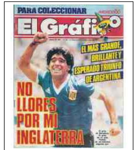
Argentina vengó su derrota militar frente a Inglaterra en el mundial de fútbol.