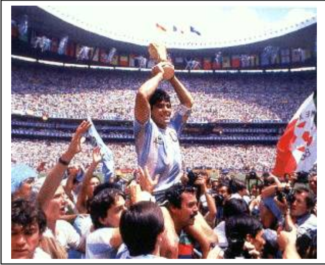
Vuelta de honor triunfal en el Azteca. Nunca volvió a volar tan alto Maradona.