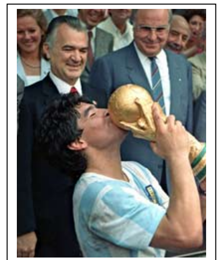
Maradona recibiendo la copa mundial de la FIFA ante el presidente mexicano y Kohl, presidente alemán.