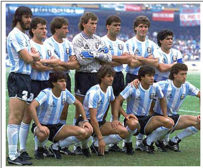
El once de la final del Azteca de 1986. Argentina consiguió su segundo entorchado mundial.

Gary Lineker, de Inglaterra, fue el máximo goleador del torneo con 6 goles. Le siguieron Butragueño, de España, Maradona de Argentina y Careca de Brasil con 5 tantos. Maradona se coronó en el Azteca, nunca más volvería a volar tan alto. El jugador del Real Madrid, Jorge Valdano, fue considerado el segundo mejor jugador del torneo.