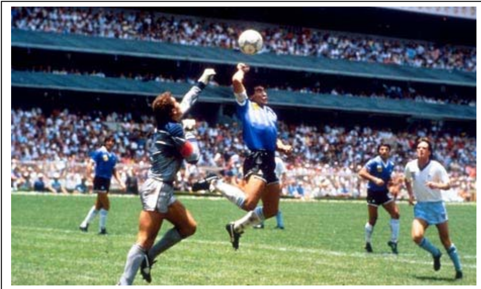
Maradona y su célebre mano de Dios. Gracias a este gol, Argentina pudo jugar el título mundial frente a Alemania.