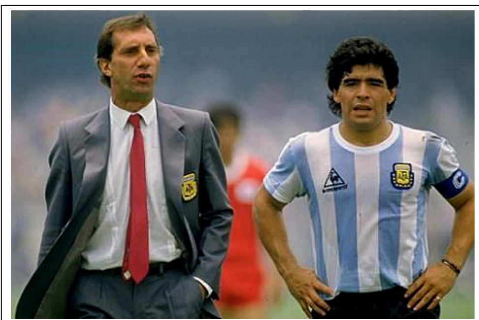
Carlos Bilardo y Diego Maradona, ellos dos llevaron a Argentina a lo más alto ocho años después.