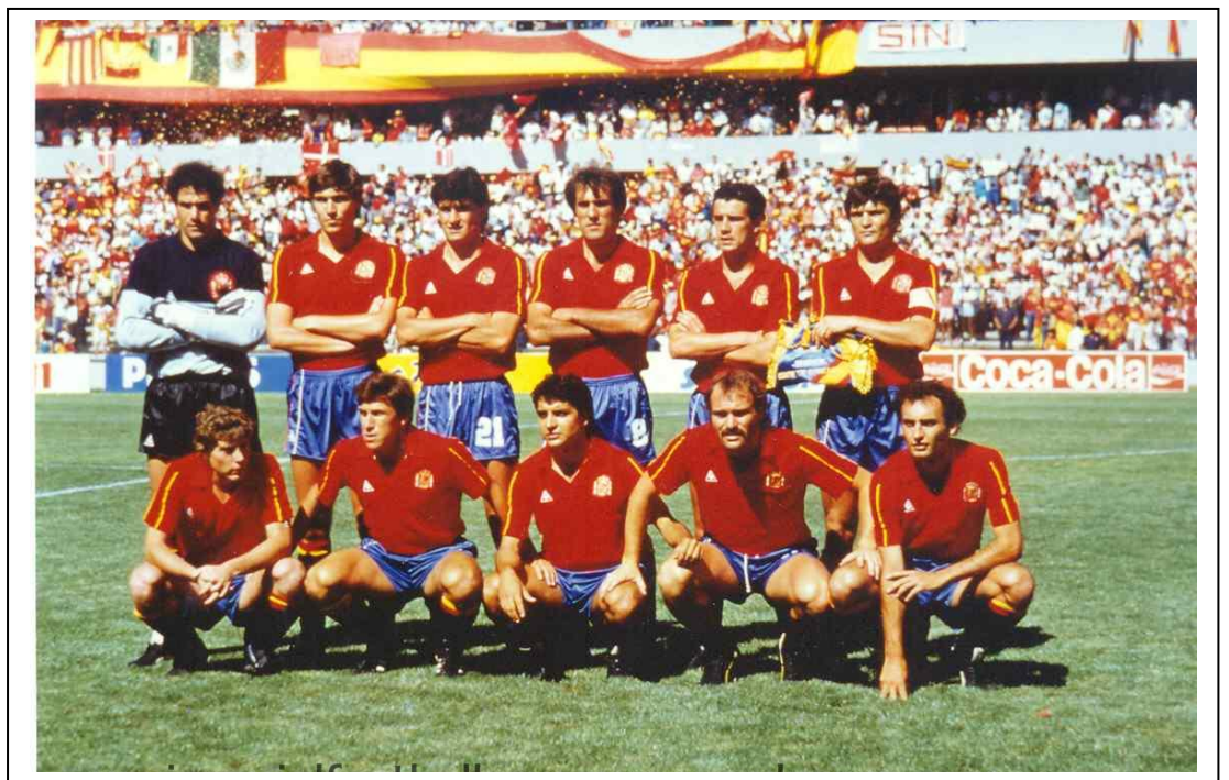
Selección española que venció en Querétaro por 5-1 a Dinamarca en Octavos de final.