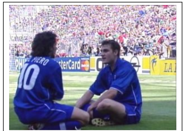
Vieri celebra con Del Piero el tanto del triunfo italiano frente a Noruega en octavos de final.