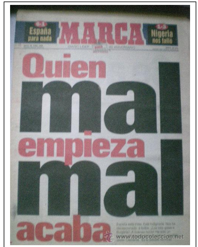
La portada del MARCA lo dice todo. El 6-1 a Bulgaria no sirvió de mucho.