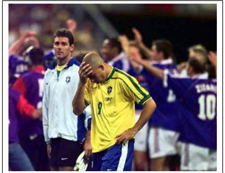
La imagen de la final de 1998. ¿Qué le había pasado a Ronaldo?