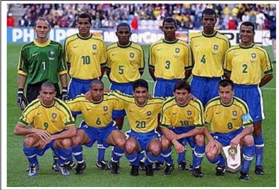
Equipo brasileño en Francia 1998.