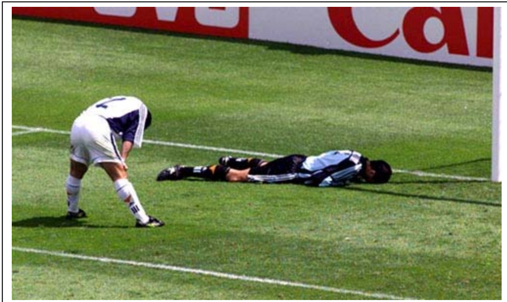
La imagen de la desolación española en 1998.