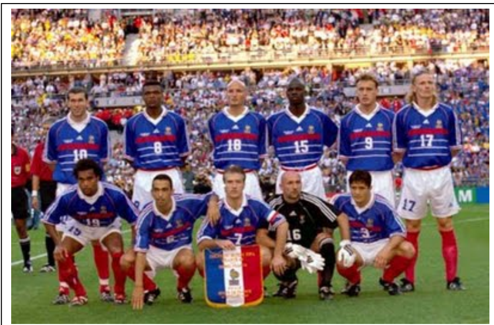
Selección francesa campeona mundial de 1998.