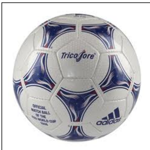
El tricolor, balón de Francia98.