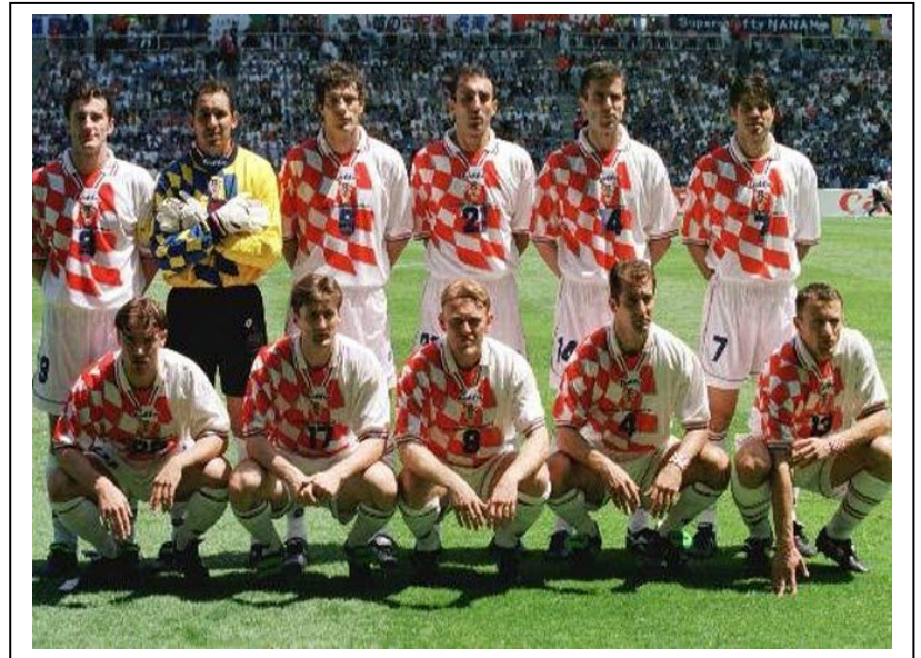
Histórico equipo de Croacia que acabó tercero en Francia98.