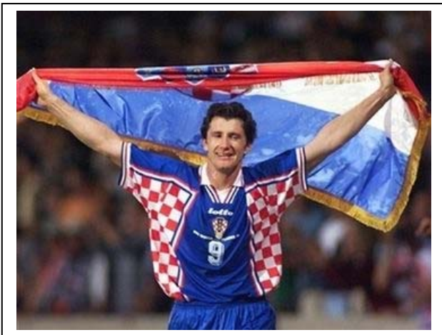
Suker se emociona por su país. Es el máximo goleador del torneo, y celebra formar parte de la tercera mejor selección del mundo.