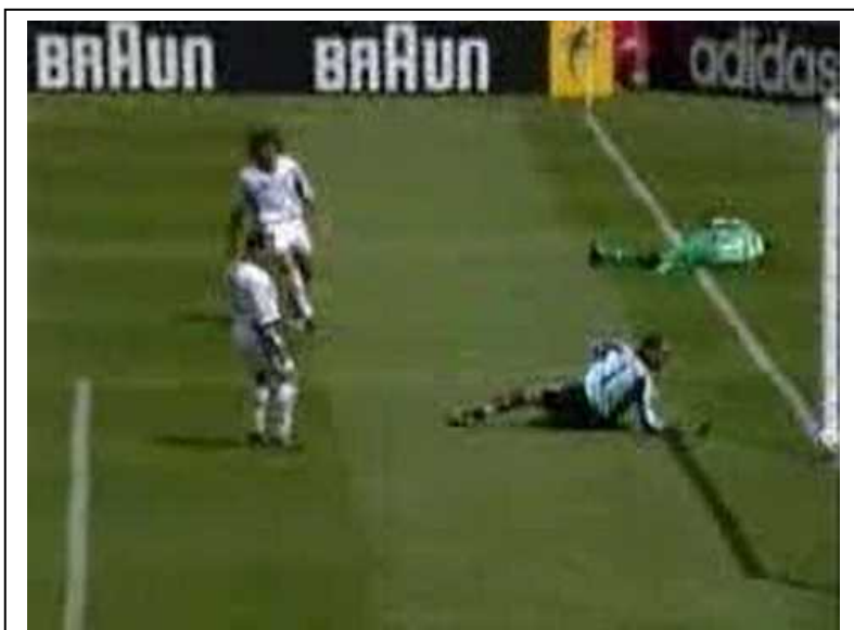
Imagen de mala calidad pero que resume el gol del 2-2. El jugador caído sobre la línea de fondo intentó centrar raso, y Zubi la empujó con su manopla derecha hacia adentro, tal y como se ve por la posición del balón.