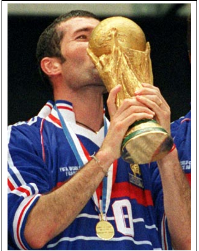
Zidane, el gran héroe francés, el mejor jugador del torneo.