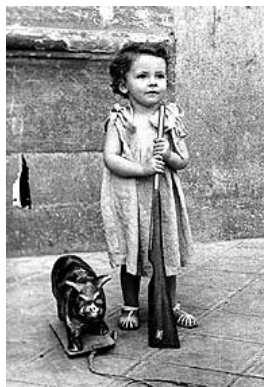
Esta foto nos dice quizá demasiado de cómo debió ser la infancia de esta niña española.