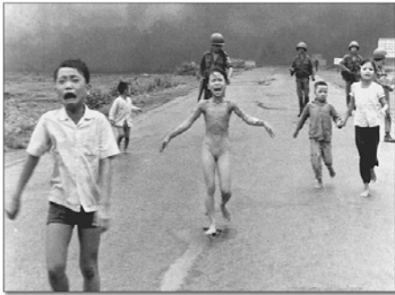
Esta imagen dio la vuelta al mundo. Vemos los efectos del NAPALM en el cuerpo de la niña que corre por el centro de la carretera. Vemos cómo después de los crueles años treinta y cuarenta persiste la violencia... esta imagen es de finales de los sesenta.