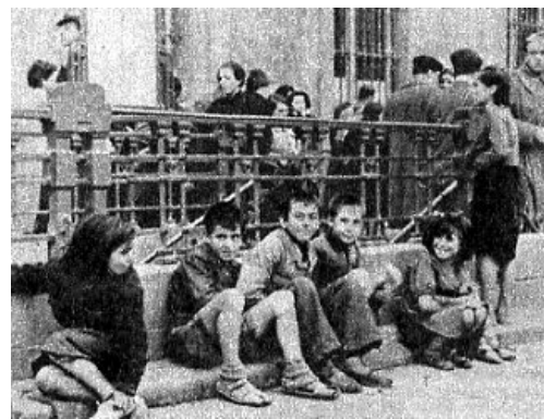
Estos chicos esperan en la boca de metro después de haber sufrido un ataque aéreo.