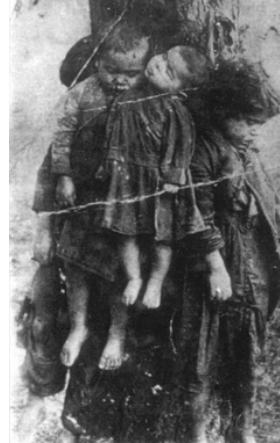
Niños colgados en un campo de China. ¿Se puede siquiera concebir tal grado de crueldad?