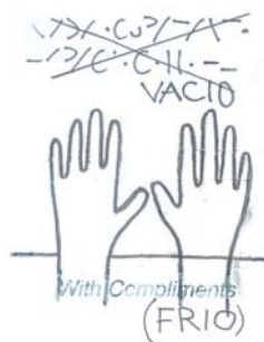
Éste es el dibujo de uno de los niños de la guerra. En el trazo desgarrado de sus letras se puede comprobar el fuerte shock que ha sufrido.

Pero quiero centrarme en los niños. Este artículo va dedicado a aquellos niños que no tuvieron infancia. Su infancia quedó marcada por los proyectiles, el humo y la falta del calor familiar, tan necesario en esas edades. Posiblemente nuestros abuelos puedan identificarse con algunos rostros de los que aparecerán a continuación. Pido perdón de antemano por la dureza de las imágenes. Pero creo que ya era hora de un artículo duro de verdad. Porque hay una realidad que no queremos ver. Y a veces, hace falta recordar que hoy día todavía hay gente que vive el mismo trauma que años atrás vivieron nuestros abuelos. Éste artículo tendrá menos letra y más imagen. Creo que una imagen vale más que mil palabras. Y algunas imágenes se describen con solo mirarlas. No se preocupen si deslizan alguna lágrima sobre sus mejillas. Estarán de enhorabuena. Eso significará que tienen alma, sentimientos y corazón. Y eso, en la sociedad en la que nos encontramos, siempre es difícil de encontrar. PERDÓN Y GRACIAS. VK.