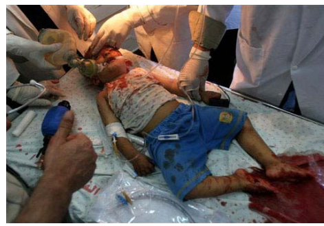
En un ataque a Gaza, Israel consiguió que este niño no pueda luchar por la paz...