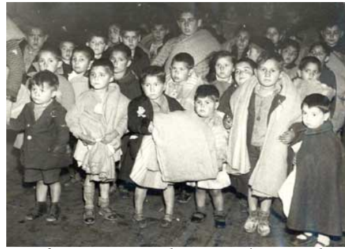
Otros fueron evacuados a países totalmente extraños para ellos. Algunos de ellos no regresarían jamás.