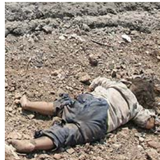
Y llegamos a la actualidad... esto es Irak. En 2003 se inició una cruel guerra que aún continúa. La infancia... la más castigada.