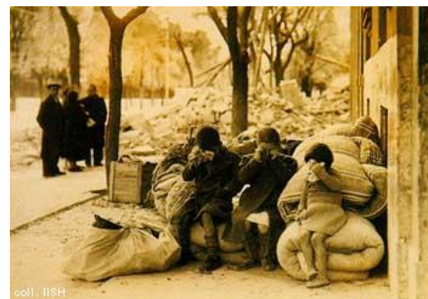
Los efectos de los bombardeos marcarán para siempre la vida de estos chicos. La Guerra Civil marcó a varias generaciones de menores españoles.