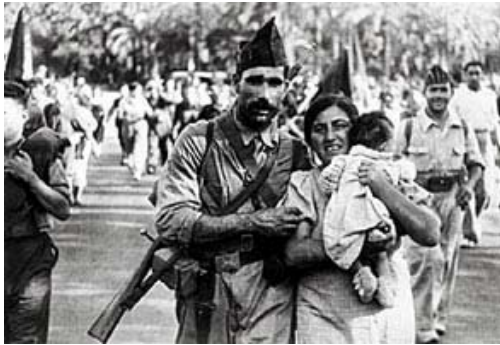
Muchos de los que se fueron al frente ya no volvieron jamás a ver a sus hijos...