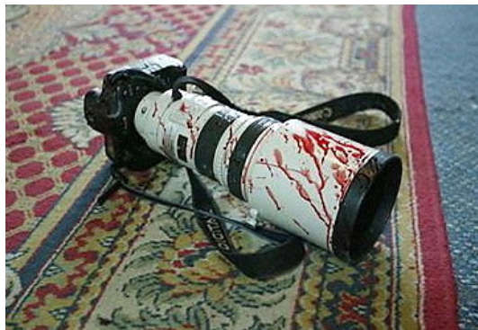
Si estas fotos no existieran posiblemente no seríamos conscientes de la realidad existente. Por eso, los fotógrafos son muy importantes. Por eso son un objetivo prioritario en la guerra...