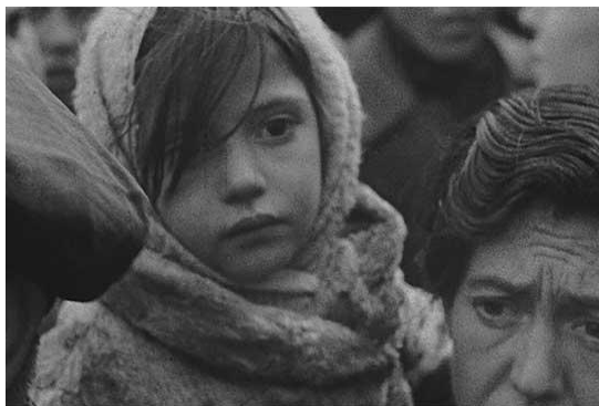
Su mirada lo dice todo...