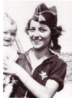
Muchas mujeres combatieron en el frente del lado republicano. En algunos casos, sus hijos nunca llegarían a conocer a sus madres...

LAS IMÁGENES QUE PODRÁN VER A CONTINUACIÓN PUEDEN HERIR SU SENSIBILIDAD. RUEGO QUE SI ES ASÍ, CIERREN INMEDIATAMENTE EL DOCUMENTO. MUCHAS GRACIAS.