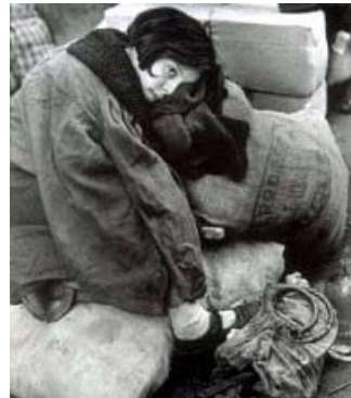
En la huida hacia la frontera...