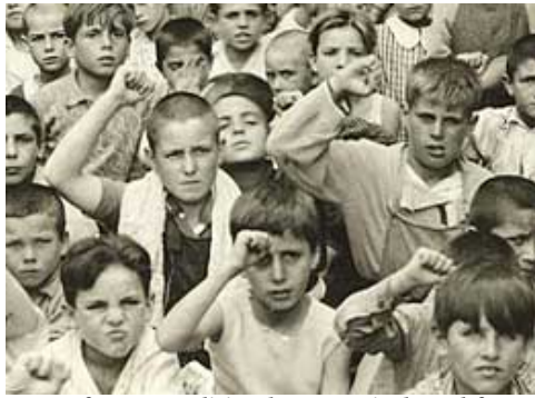
Algunos fueron politizados y enviados al frente...