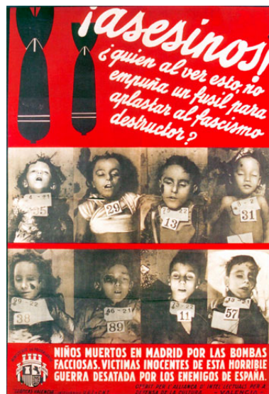
Este cartel de propaganda republicano nos muestra niños y niñas que nunca podrán formar familias ni contar a sus hijos y nietos sus experiencias. Sin embargo, nos están contando ahora mismo, qué es, de verdad, una guerra.