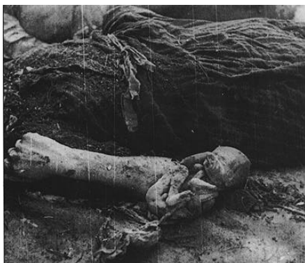
Esta mujer no podrá enseñar a su hijo ni darle su amor. La guerra lo ha evitado...

LAS IMÁGENES QUE PODRÁN VER A CONTINUACIÓN PUEDEN HERIR SU SENSIBILIDAD. RUEGO QUE SI ES ASÍ, CIERREN INMEDIATAMENTE EL DOCUMENTO. MUCHAS GRACIAS.