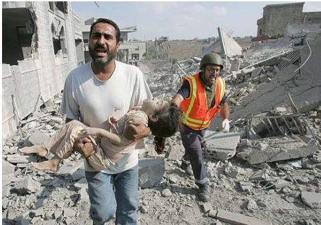
Este padre no comprende por qué han bombardeado su casa. Su hija, ya no podrá oler flores...