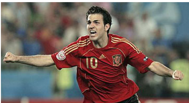
Cesc Fàbregas marca el último penalti contra Italia. España pasaba a semifinales.