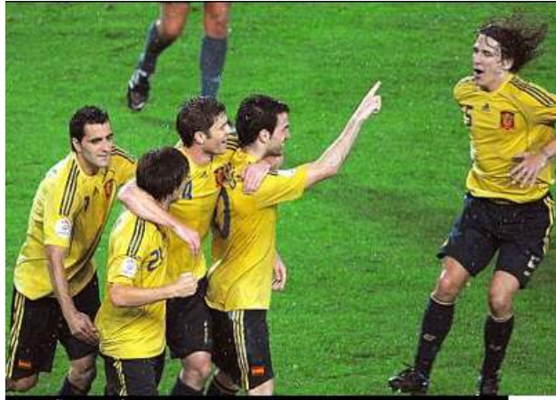
España trituró a Rusia.