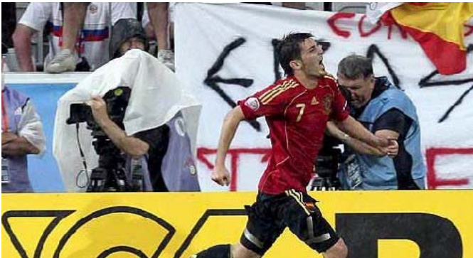
David Villa en una de sus celebraciones contra Rusia en la primera fase.