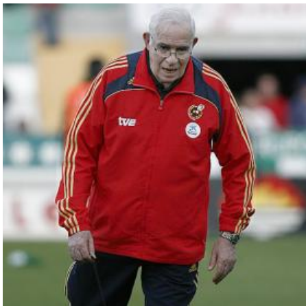
El seleccionador Aragonés en fase REM.