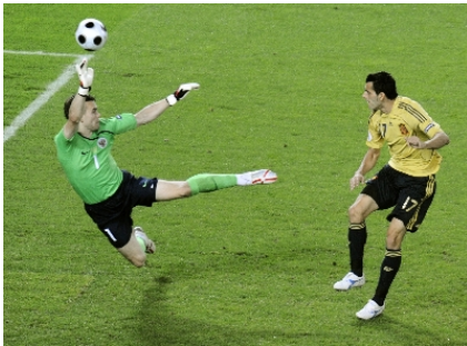
Güiza puso la guinda frente a Rusia.