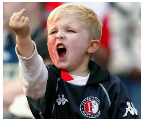
Este chaval holandés le muestra un amable gesto de cariño a Italia. Igual hizo España frente a los alemanes y frente a su historia reciente.