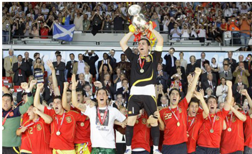
Momento en el que Casillas levanta el título para España. La segunda Eurocopa.