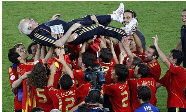
El clásico manteo al seleccionador campeón.