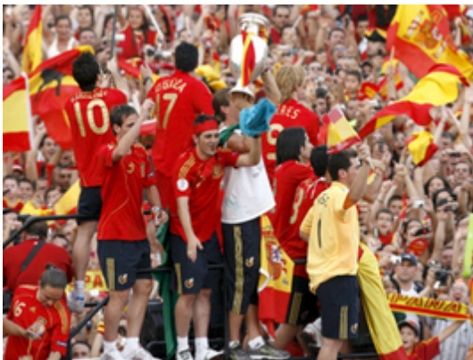
Triunfal recibimiento a España en Madrid.