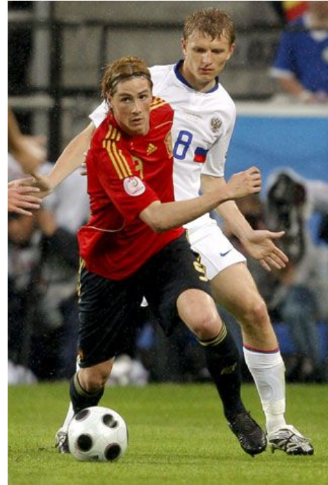
Fernando Torres en un lance contra Rusia en la primera fase.