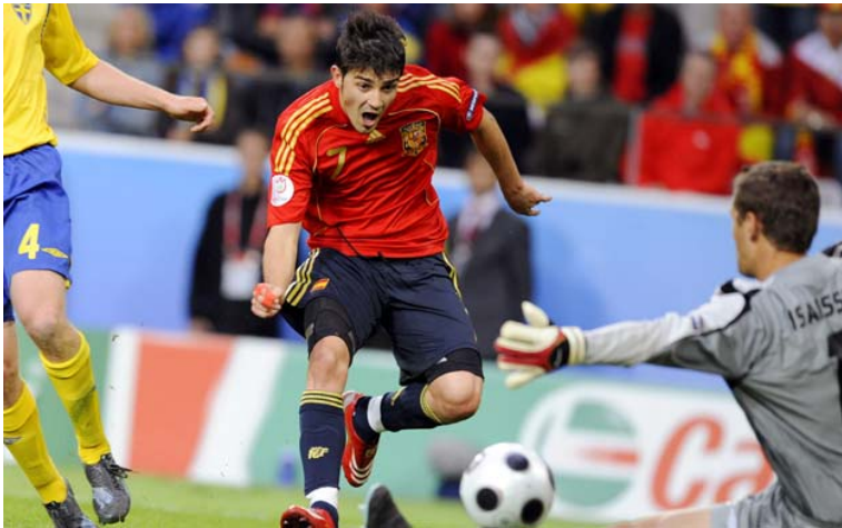
David Villa marcando un gol decisivo contra Suecia (el 2-1).