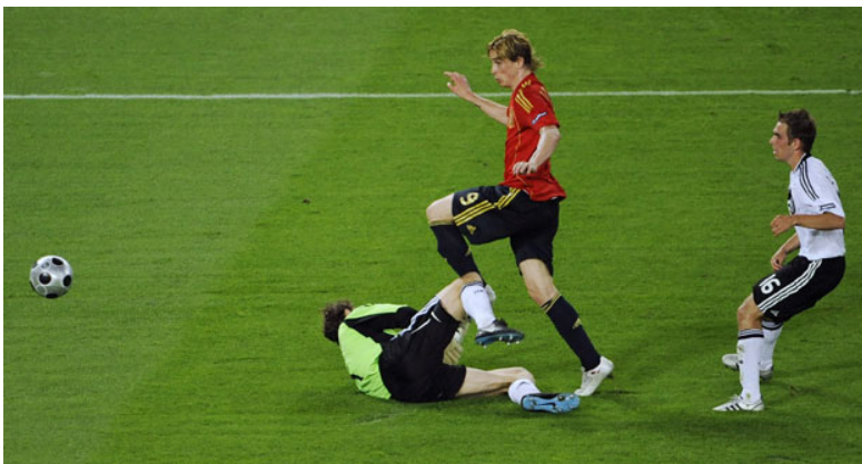
Torres marca el gol del triunfo de España en la final de Viena frente a Alemania. 29-6-2008.