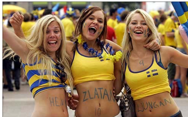
Las suecas (que no están mal, todo hay que decirlo... eeeee... a lo que voy...) pensaban que ganar a España iba a ser cosa fácil. No fue así.