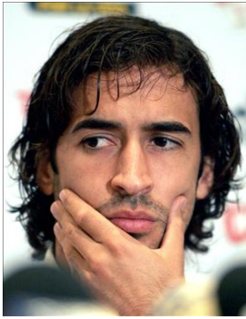
Raúl en el momento en que Casillas levanta el título para España.